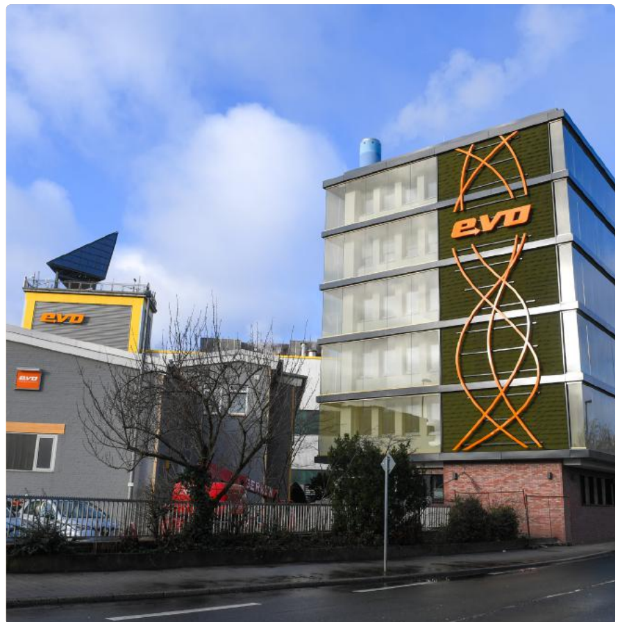
Abbildung rechts: Imagebild, copyright evo Oberhausen

Dabei versteht sich die evo nicht einfach nur als ein Energieversorger oder ein Stadtwerk, sondern ebenso ist das Engagement für die Stadt und die hier lebenden Menschen ein erklärtes Unternehmensziel. Neben der finanziellen Unterstützung in den Bereichen Sport, Kultur und Soziales hat sich die „Oberhausen Crowd“ als Erfolgsgeschichte etabliert. Die hauseigene Crowdfunding-Plattform der evo konnte bis Ende 2021 Spenden von knapp 222.500 Euro sammeln. Rund 47.000 Euro gab die evo aus ihren Crowd-Fördertöpfen hinzu. Der Förderung von Kindern und Jugendlichen kommt dabei ein besonderes Augenmerk zu. Darüber hinaus ist die evo in Oberhausen ein beliebter und wichtiger Arbeitgeber.