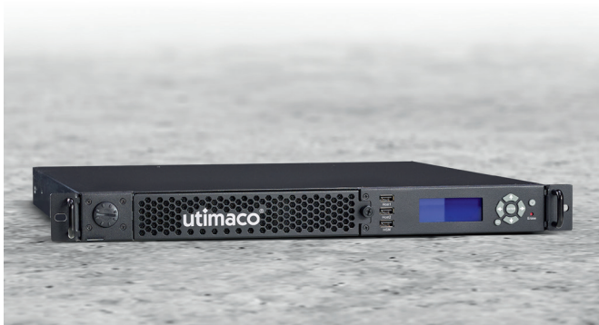
Abbildung oben: CryptoServer CP5 von utimaco

Die Fernsignatur, auch Remote Signature genannt, ermöglicht die Anbringung einer fortgeschrittenen oder qualifizierten elektronischen Signatur ohne Signaturkarte und ohne spezielle Software direkt aus dem Browser heraus. Eine vorherige Identitätsprüfung ist dabei vorgeschrieben. Der Aufenthaltsort – ob Arbeitsplatz oder Homeoffice – spielt dabei keine Rolle, der Signaturprozess kann von unterwegs auf mobilen Endgeräten vorgenommen werden. Vor allem bei Vertragsangelegenheiten, welche zwingend eine Signatur erfordern, aber auch bei Verträgen, die von mehreren Personen unterzeichnet werden müssen, ist diese Art der Fernsignatur empfehlenswert und stellt eine zeitliche Erleichterung dar. Die Abbruchraten von Vertragsunterzeichnungen sinken somit enorm.